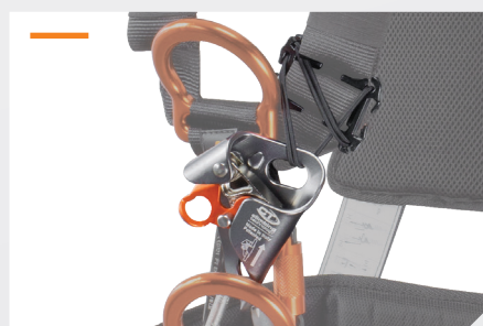
TENDEUR DE BLOQUEUR INCLUS RÉF. NUS131A + BLOQUEUR VENTRAL EN OPTION RÉF. NBLOCK