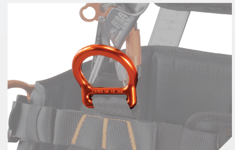
POINT D'ACCROCHAGE VENTRAL DE SUSPENSION PAR D ALUMINIUM