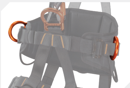
POINTS D'ACCROCHAGE LATÉRAL DE MAINTIEN AU TRAVAIL PAR D ALUMINIUM