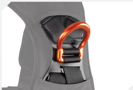
POINT D'ACCROCHAGE ANTICHUTE DORSAL PAR D ALUMINIUM