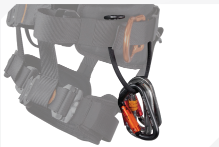
PORTE OUTILS (X2) + SANGLES CORDON PORTE OUTIL GRANDE CAPACITÉ (X3)