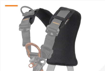
DOSSERET ÉPAULE AVEC TISSU 3D RESPIRANT