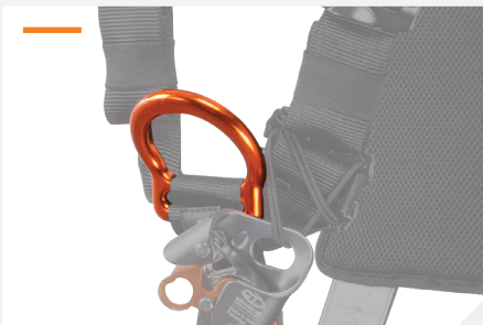
POINT D'ACCROCHAGE ANTICHUTE STERNAL PAR D ALUMINIUM