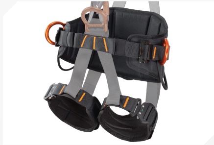
LARGES CUISSARDS ET CEINTURE DE MAINTIEN AVEC TISSU 3D RESPIRANT