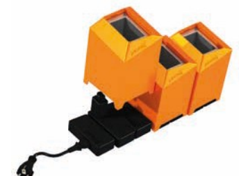
Adaptateur à chargement multiples pour exploiter jusqu'à 10 stations de recharge sur une ligne