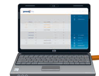
pewag levo manager Logiciel complet pewag Module de pesage