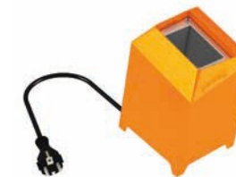
Station de charge