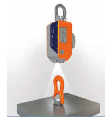
Module d'éclairage Zone de travail complètement éclairée.