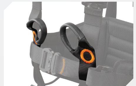
POINTS D'ACCROCHAGE VENTRAL DE MAINTIEN AU TRAVAIL PAR BOUCLES À RELIER