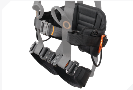
LARGE CUISSARD ET CEINTURE DE MAINTIEN AVEC TISSU 3D RESPIRANT