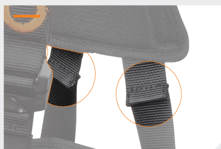
TÉMOINS DE CHUTE