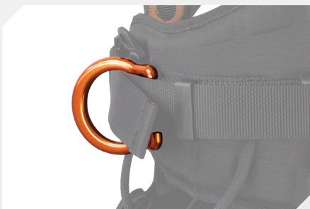
POINTS D'ACCROCHAGE LATÉRAL DE MAINTIEN AU TRAVAIL PAR DÉ ALUMINIUM PIVOTANT