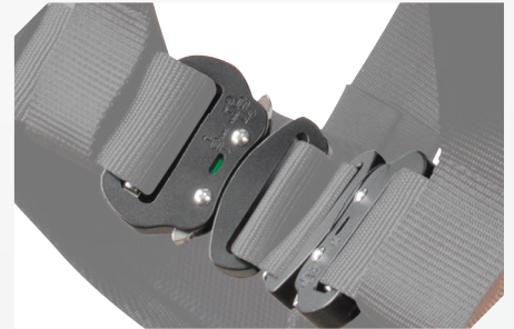
BOUCLES DEVERROUILLAGE AUTOMATIQUE ET ALUMINIUM AVEC TÉMOIN DE FERMETURE