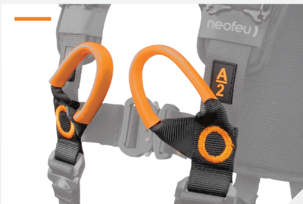
POINTS D'ACCROCHAGE ANTICHUTE STERNAL PAR BOUCLES À RELIER