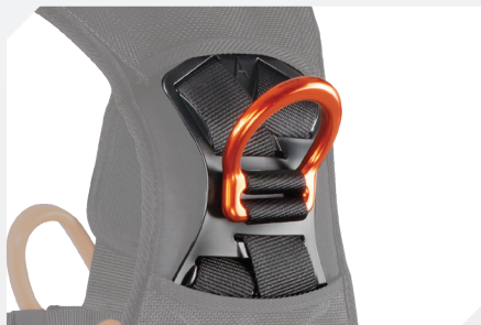
POINT D'ACCROCHAGE ANTICHUTE DORSAL PAR DÉ ALUMINIUM