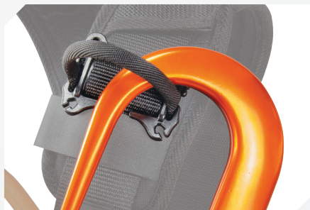
PORTE LONGE AMOVIBLE (X2)