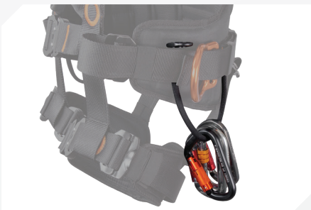
PORTE OUTILS (X2) + SANGLES CORDON PORTE OUTIL GRANDE CAPACITÉ (X3)