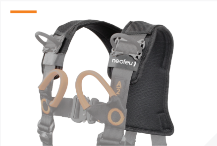
DOSSERET ÉPAULE AMOVIBLE AVEC TISSU 3D RESPIRANT