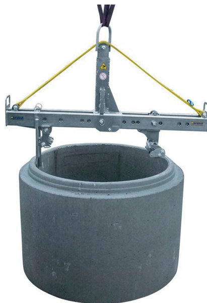
Tableau des mesures